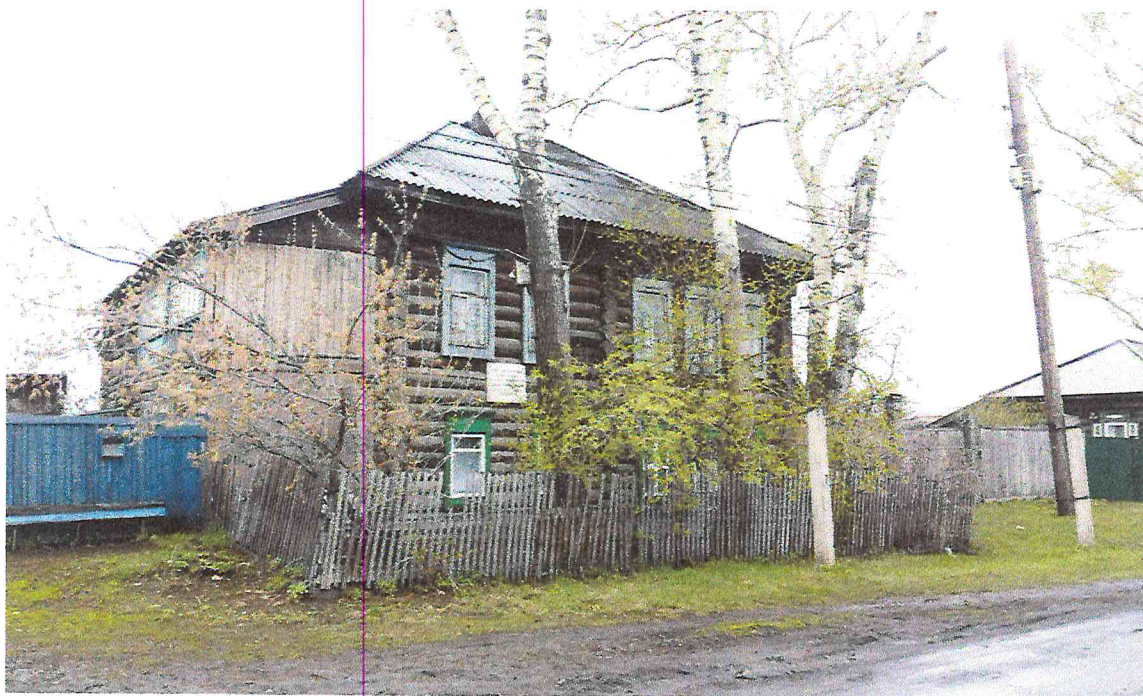
Рисунок 2. Объект культурного наследия регионального значения «Дом, в котором с 1914-1916 гг. жила, находясь в ссылке, старейший деятель революционного движения России Стасова Е.Д». Фото 2018 г.