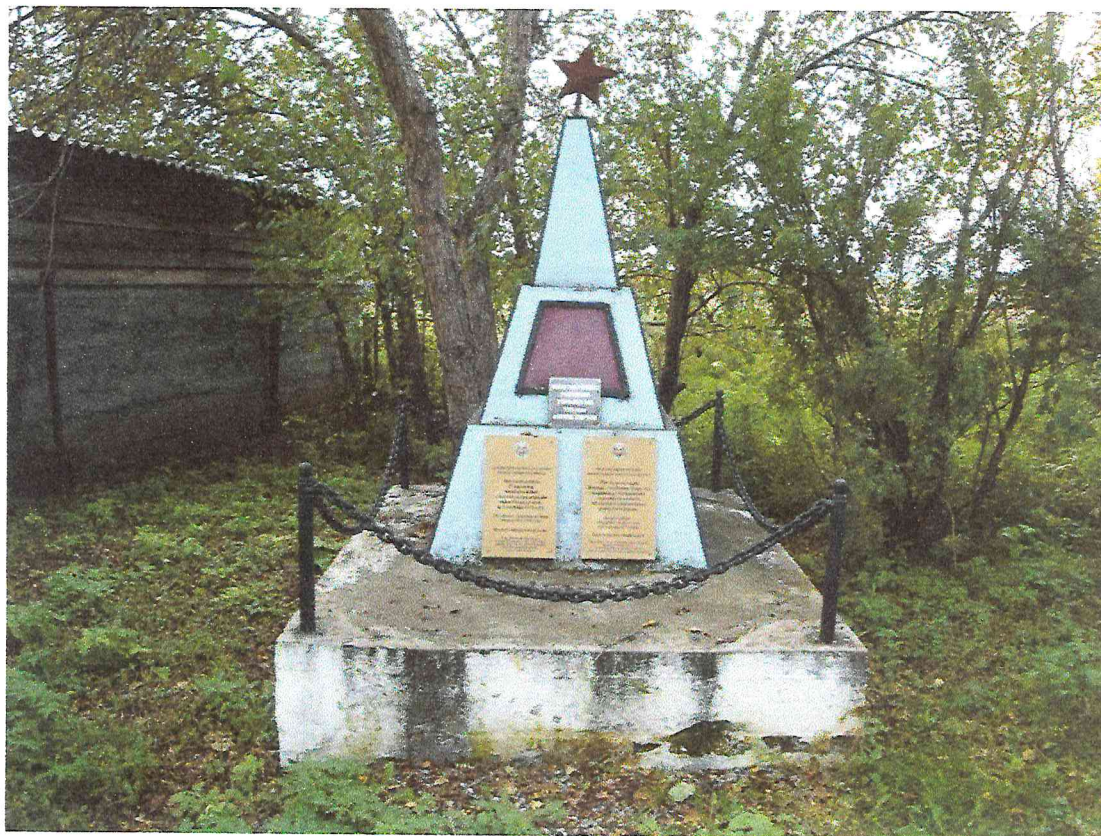
Рисунок 1. Объект культурного наследия регионального значения «Братская могила 27 партизан, погибших в бою с колчаковским отрядом под д. Очуры в ночь на 3 октября 1919 г.». Фото 2017 г.