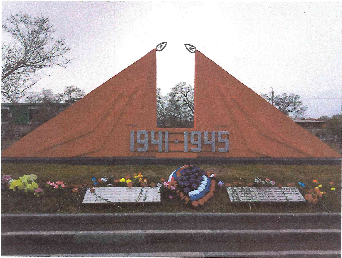
Рисунок 1. Объект культурного наследия регионального значения «Братское кладбище воинов Советской Армии - участников Великой Отечественной войны 1941 - 1945 гг., умерших в госпиталях г. Абакана». Фото 2018 г.