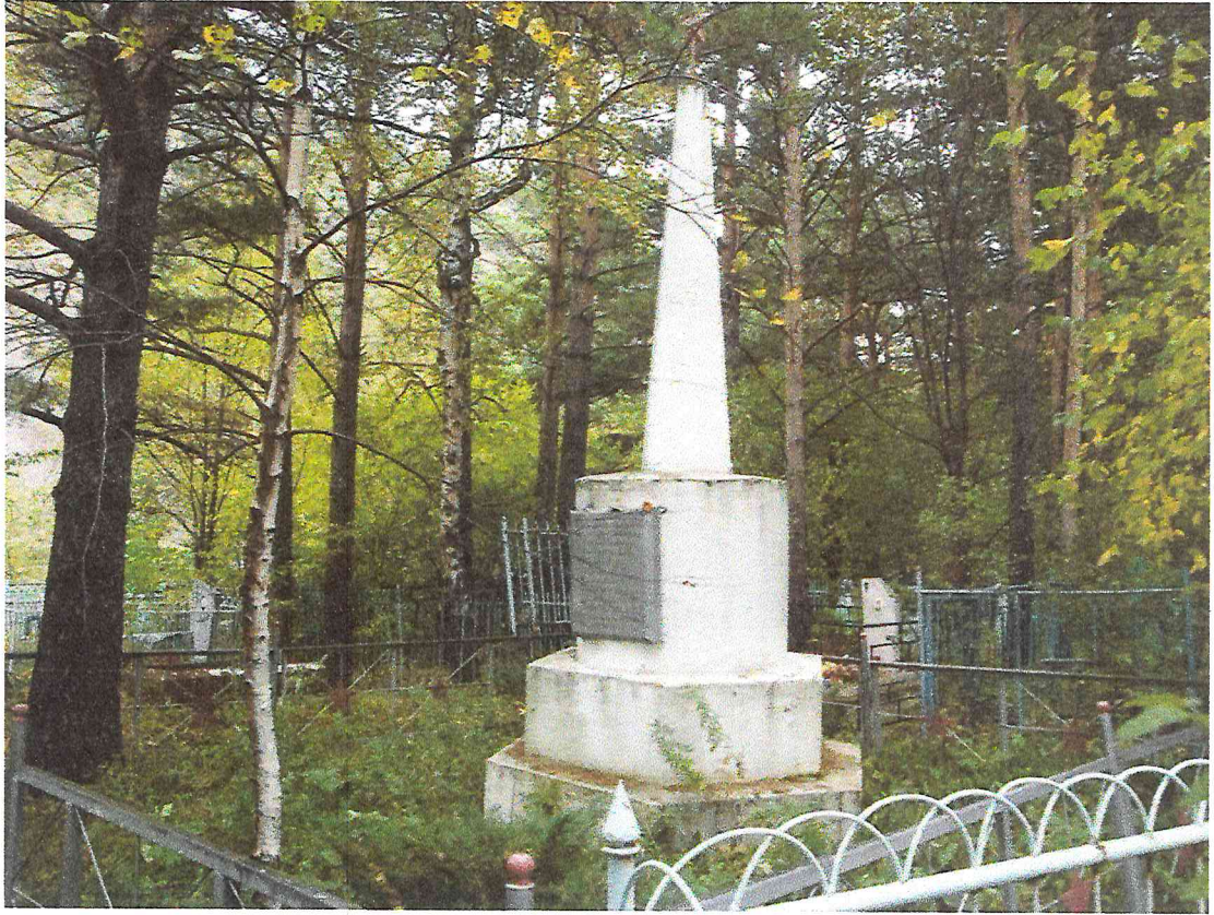
Рисунок 1. Объект культурного наследия регионального значения «Братская могила рабочих Абаканского железодельательного завода, убитых белогвардейцами в декабре 1919 г.». Фото 2017 г.