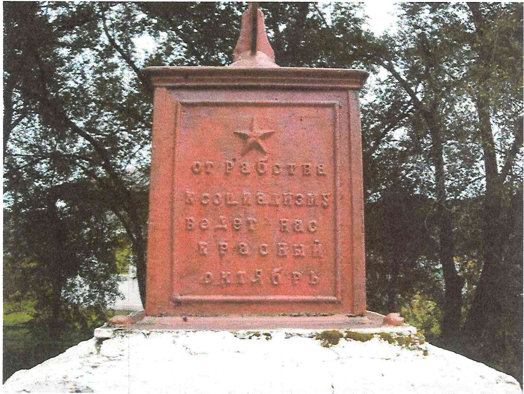
Рисунок 4. Объект культурного наследия регионального значения «Обелиск в память погибших в борьбе за установление Советской власти девяти рабочих чугуно-литейного завода». Фото 2017 г.