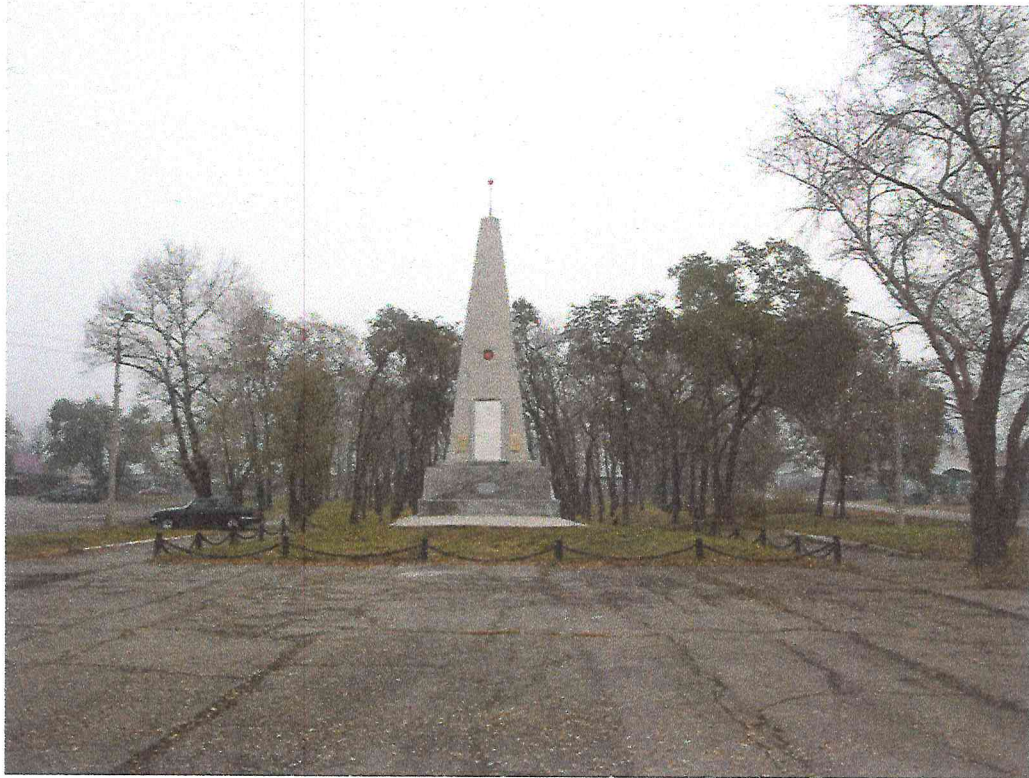
Рисунок 2. Объект культурного наследия регионального значения «Обелиск «Павшим коммунарам» сооружен в 1927 году в память погибшим за установление и защиту Советской власти в Хакасии». Фото 2017 г.