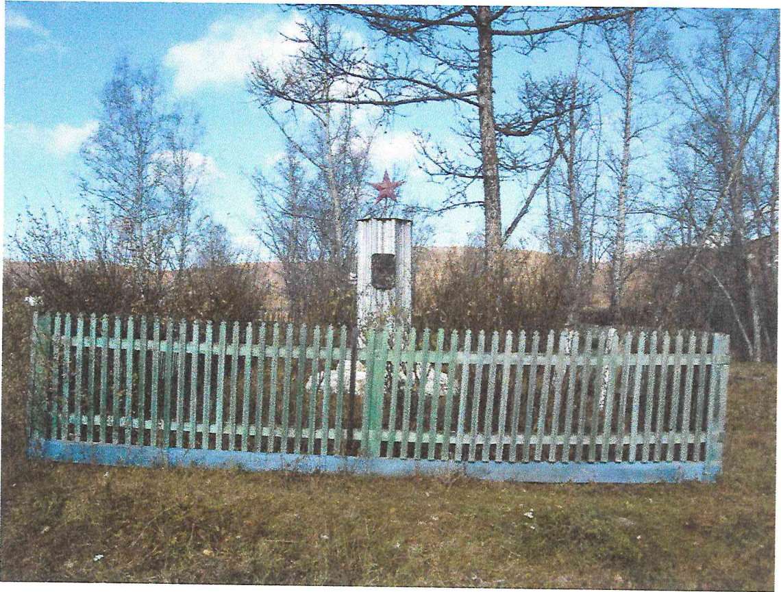
Рисунок 1. Объект культурного наследия регионального значения «Братская могила борцов, погибших за Советскую власть в 1920 г.». Фото 2017 г.