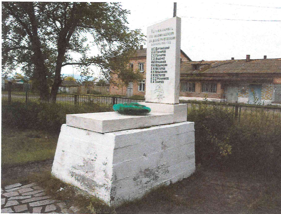
Рисунок 1. Объект культурного наследия регионального значения «Братская могила крестьян, выступивших против колчаковского режима и расстрелянных в декабре 1918 года карательным отрядом». Фото 2017 г.