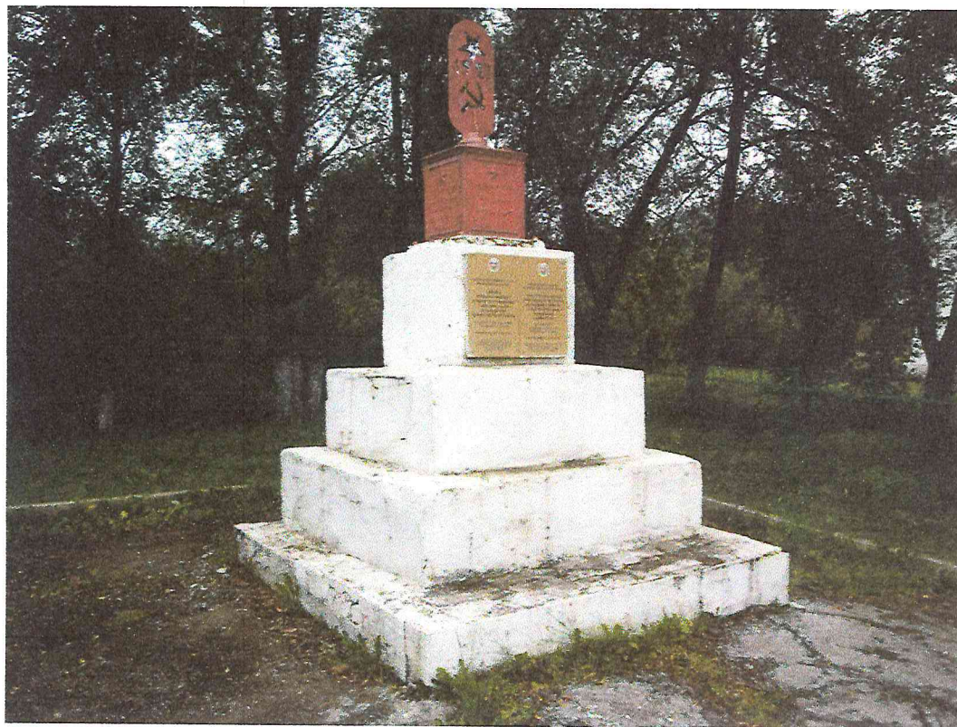
Рисунок 2. Объект культурного наследия регионального значения «Обелиск в память погибших в борьбе за установление Советской власти девяти рабочих чугуно-литейного завода». Фото 2017 г.