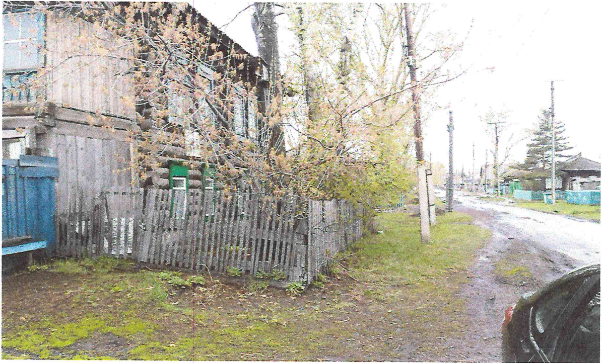
Рисунок 6. Объект культурного наследия регионального значения «Дом, в котором с 1914-1916 гг. жила, находясь в ссылке, старейший деятель революционного движения России Стасова Е.Д». Фото 2018 г.