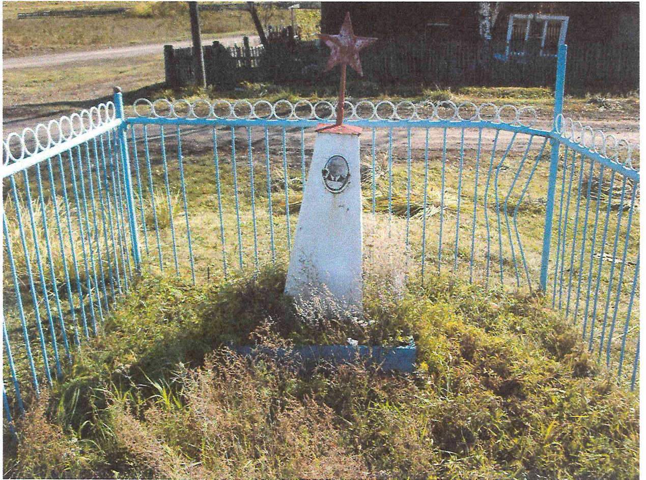
Рисунок 1. Объект культурного наследия регионального значения «Могилы Пономарева Ф.Г., первого председателя сельсовета, убитого кулаками 7 января 1937 г.». Фото 2017 г.