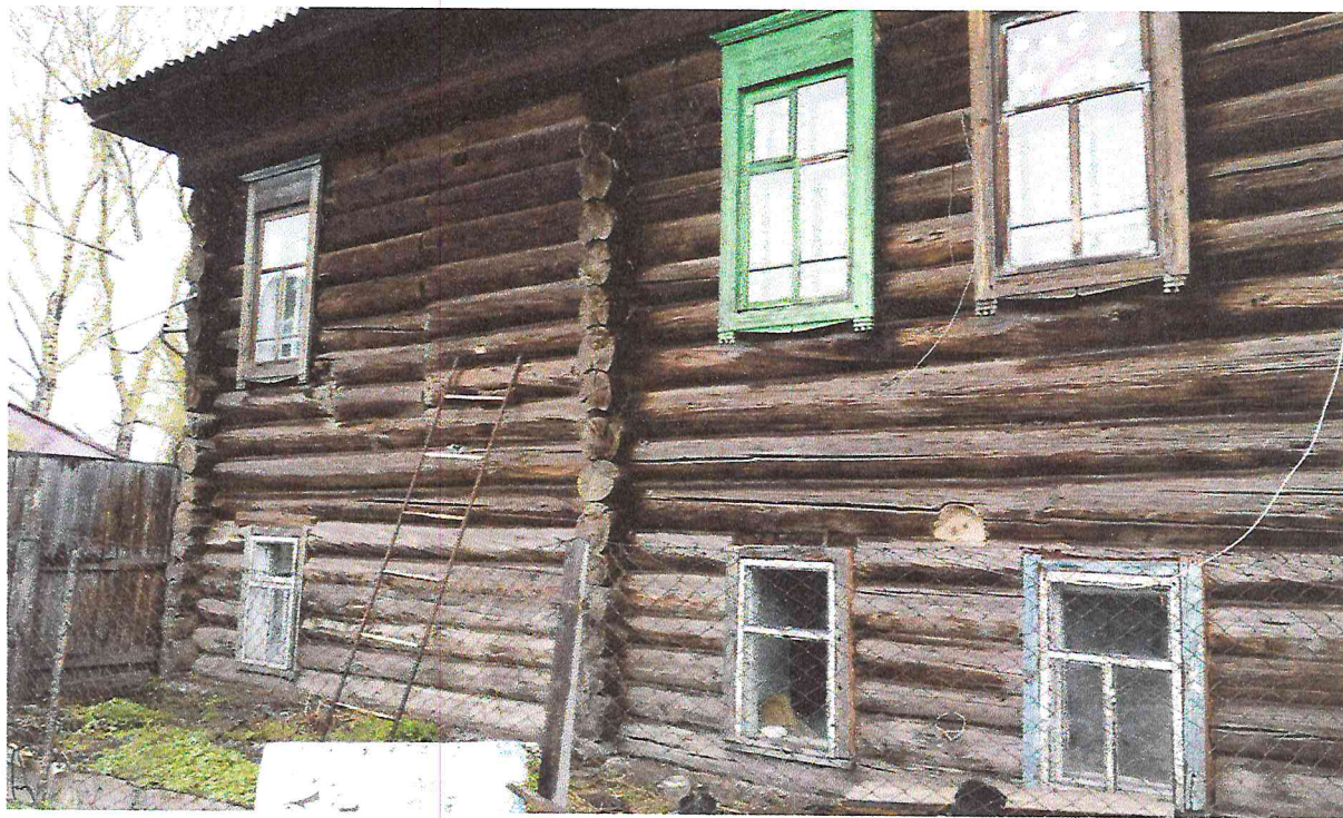
Рисунок 8. Объект культурного наследия регионального значения «Дом, в котором с 1914-1916 гг. жила, находясь в ссылке, старейший деятель революционного движения России Стасова Е.Д». Фото 2018 г.