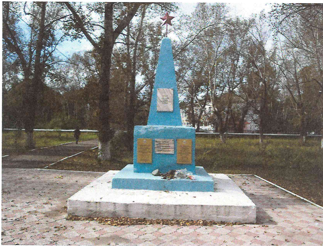
Рисунок 1. Объект культурного наследия регионального значения «Братская могила участников отряда ЧОН, погибших 4 февраля 1921 года в бою с белогвардейской бандой Олиферова». Фото 2017 г.