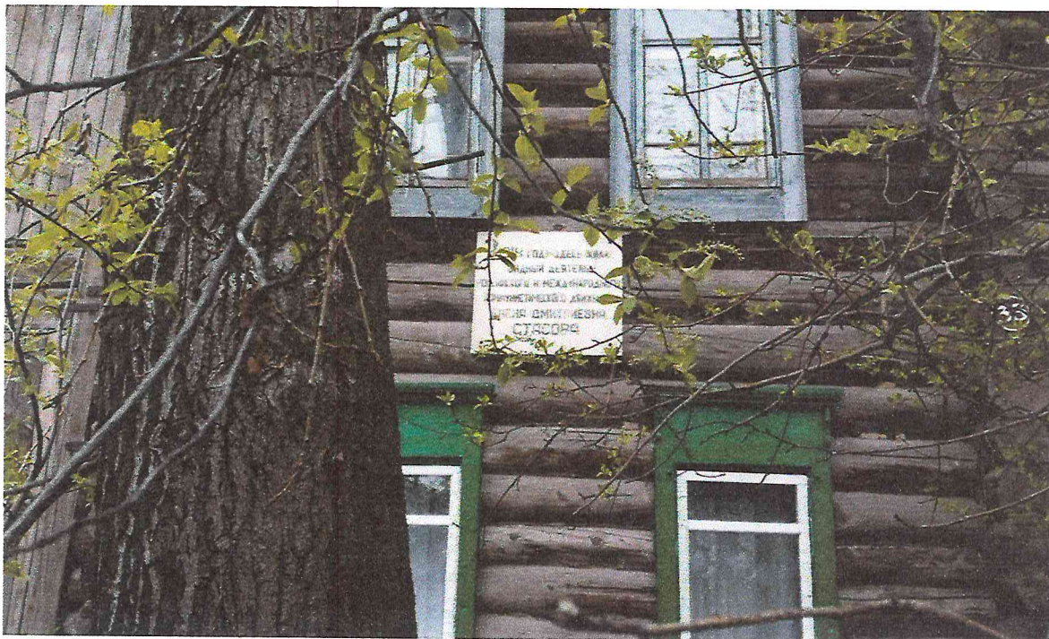
Рисунок 4. Объект культурного наследия регионального значения «Дом, в котором с 1914-1916 гг. жила, находясь в ссылке, старейший деятель революционного движения России Стасова Е.Д». Фото 2018 г.