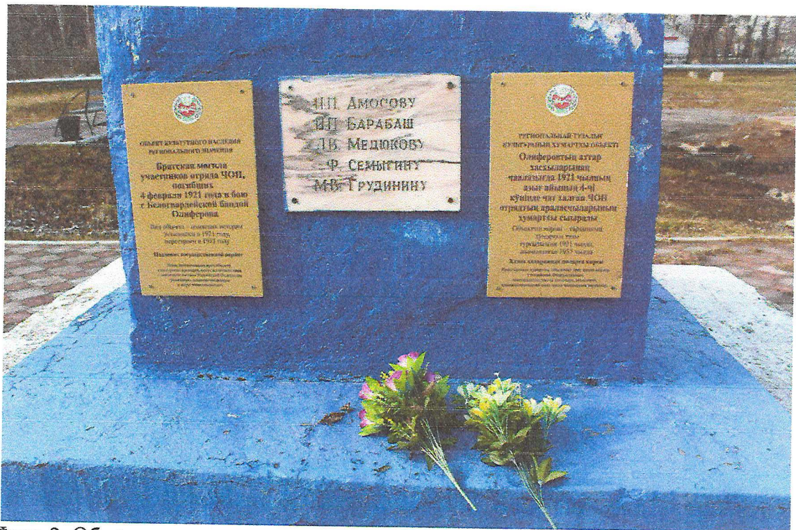
Фото 2. Объект культурного наследия регионального значения «Братская могила участников отряда ЧОН, погибших 4 февраля 1921 года в бою с белогвардейской бандой Олиферова».