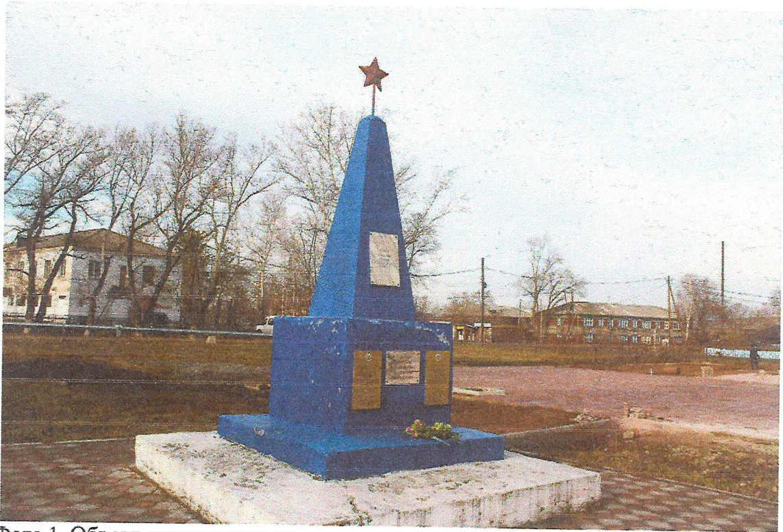
Фото 1. Объект культурного наследия регионального значения «Братская могила участников отряда ЧОН, погибших 4 февраля 1921 года в бою с белогвардейской бандой Олиферова».

Фотографическое (иное графическое) изображение объекта культурного наследия (на момент утверждения охранного обязательства)