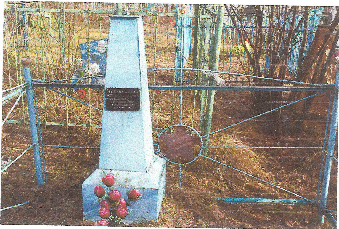
Фото 2. Объект культурного наследия регионального значения «Братская могила партизан и мирных жителей, расстрелянных белогвардейцами в декабре 1919 г.»