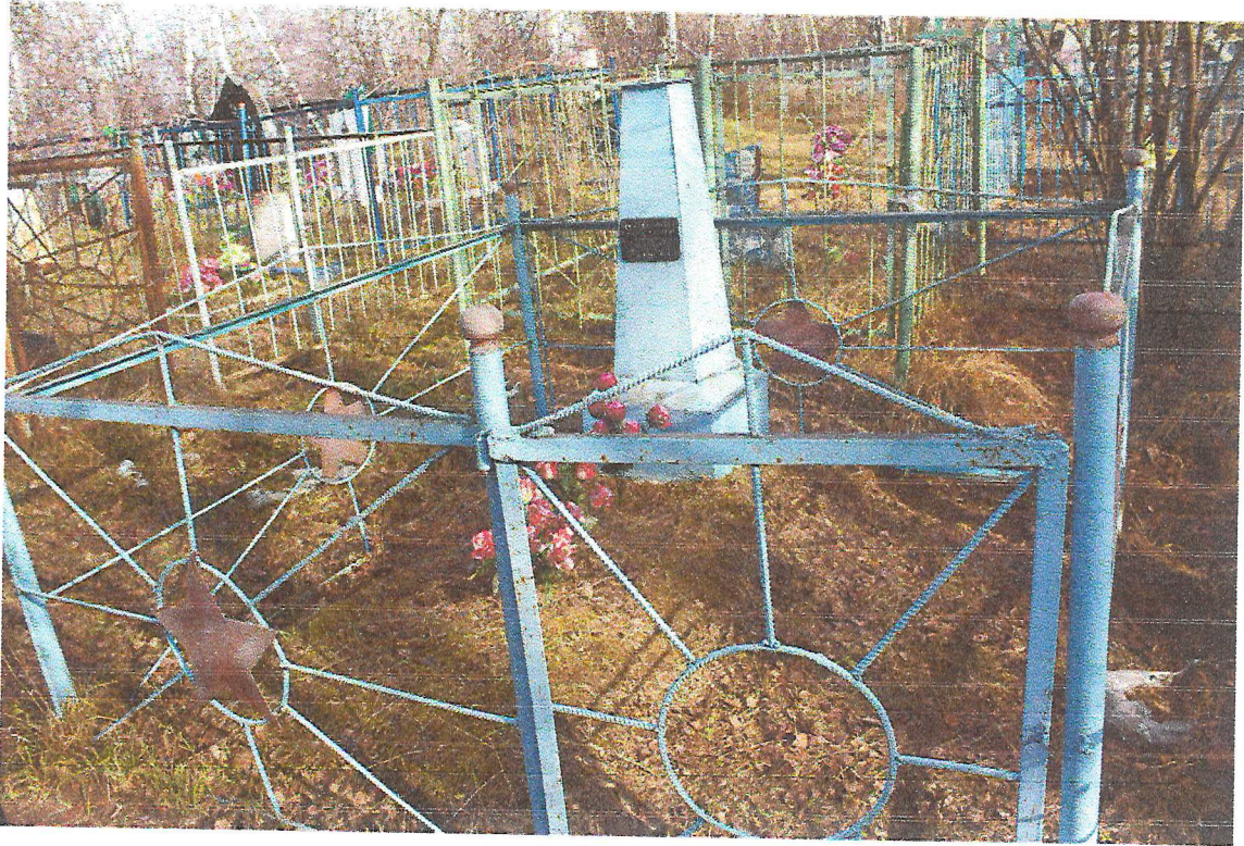
Фото 1. Объект культурного наследия регионального значения «Братская могила партизан и мирных жителей, расстрелянных белогвардейцами в декабре 1919 г.»

Фотографическое (иное графическое) изображение объекта культурного наследия (на момент утверждения охранного обязательства)