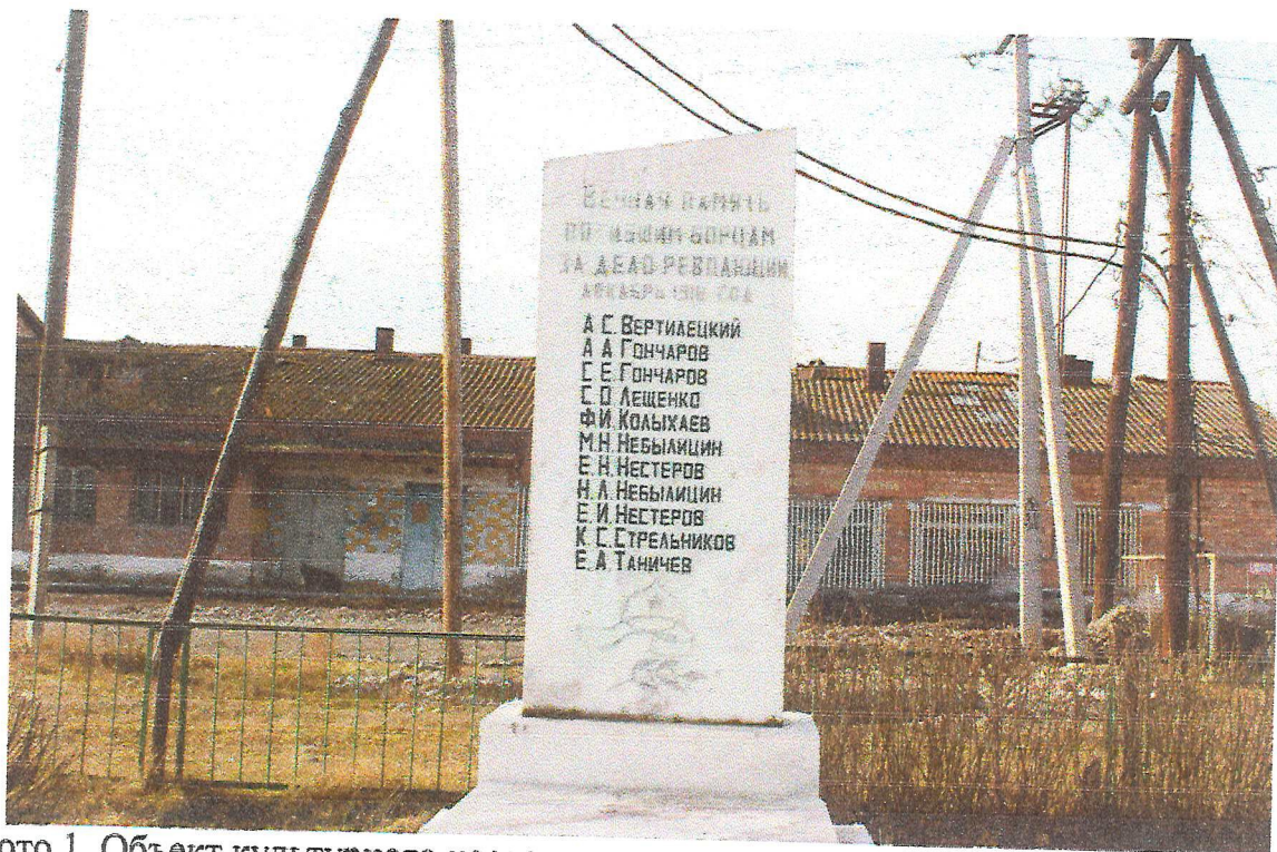
Фото 1. Объект культурного наследия регионального значения «Братская могила крестьян, выступивших против колчаковского режима и расстрелянных в декабре 1918 г. карательным отрядом».

Фотографическое (иное графическое) изображение объекта культурного наследия (на момент утверждения охранного обязательства)