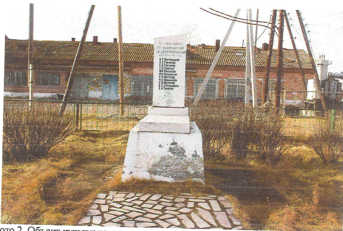
Фото 2. Объект культурного наследия регионального значения «Братская могила крестьян, выступивших против колчаковского режима и расстрелянных в декабре 1918 г. карательным отрядом».