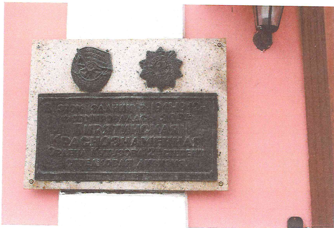
Фото 3. Объект культурного наследия «Здание, в котором в 1941-1942 гг. формировалась 309 Пирятинская краснознаменная Ордена Кутузова II степени стрелковая дивизия»