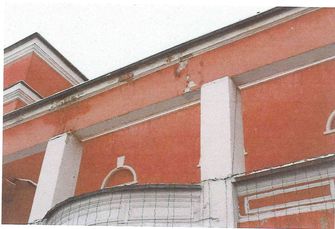
Фото 4. Объект культурного наследия «Здание, в котором в 1941-1942 гг. формировалась 309 Пирятинская краснознаменная Ордена Кутузова II степени стрелковая дивизия»