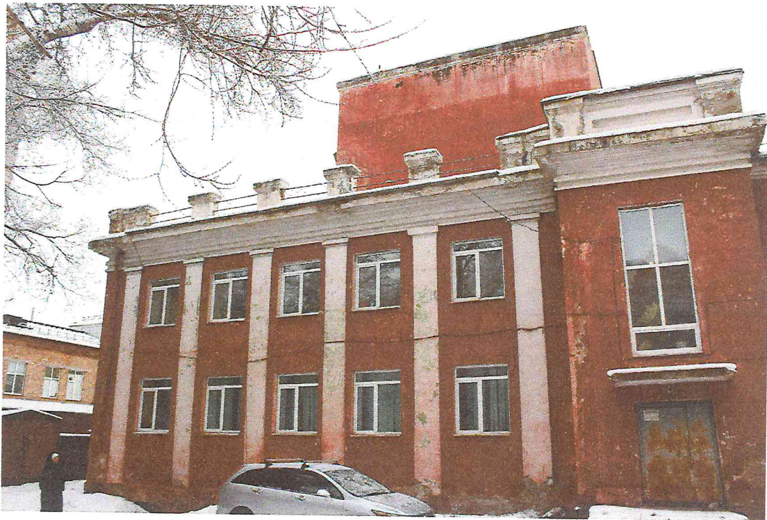
Фото 6. Объект культурного наследия «Здание, в котором в 1941-1942 гг. формировалась 309 Пирятинская краснознаменная Ордена Кутузова II степени стрелковая дивизия»