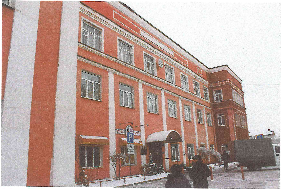
Фото 2. Объект культурного наследия «Здание, в котором в 1941-1942 гг. формировалась 309 Пирятинская краснознаменная Ордена Кутузова II степени стрелковая дивизия»