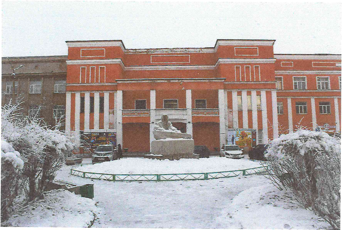
Фото 1. Объект культурного наследия «Здание, в котором в 1941-1942 гг. формировалась 309 Пирятинская краснознаменная Ордена Кутузова II степени стрелковая дивизия»