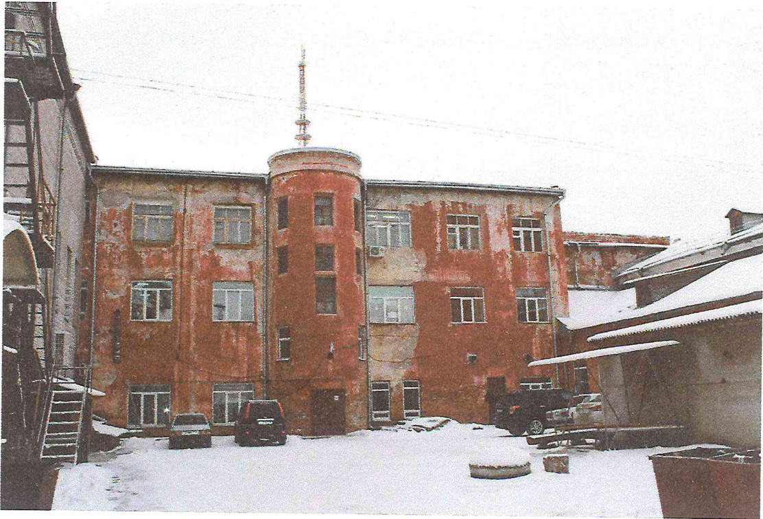
Фото 5. Объект культурного наследия «Здание, в котором в 1941-1942 гг. формировалась 309 Пирятинская краснознаменная Ордена Кутузова II степени стрелковая дивизия»