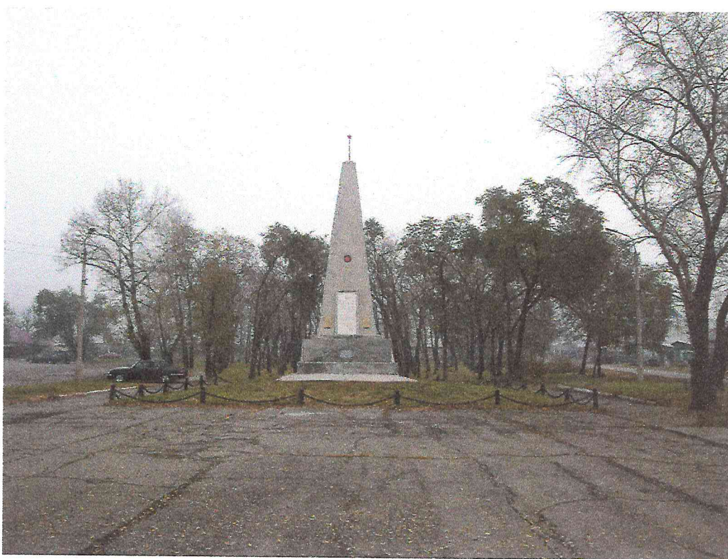
Фото 2. Объект культурного наследия «Обелиск «Павшим коммунарам» сооружен в 1927 году в память погибшим за установление и защиту Советской власти в Хакасии»