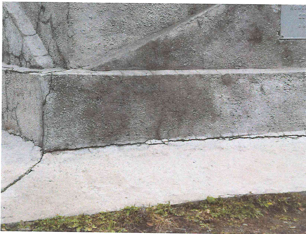
Фото 6. Объект культурного наследия «Обелиск «Павшим коммунарам» сооружен в 1927 году в память погибшим за установление и защиту Советской власти в Хакасии»