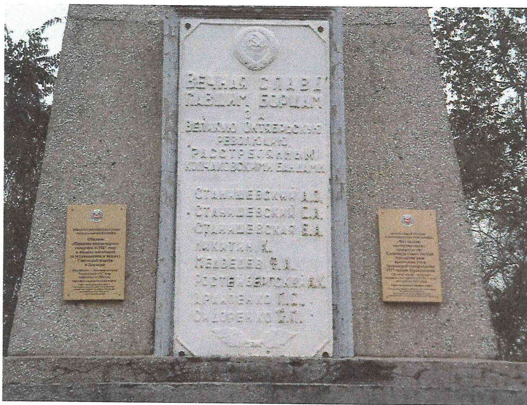
Фото 4. Объект культурного наследия «Обелиск «Павшим коммунарам» сооружен в 1927 году в память погибшим за установление и защиту Советской власти в Хакасии»