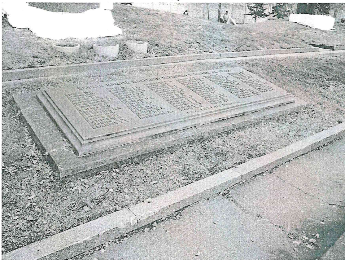
Фото 6. Объект культурного наследия «Братская могила 89 шахтеров, погибших в 1931 году»