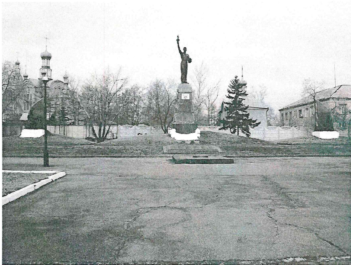
Фото 2. Объект культурного наследия «Братская могила 89 шахтеров, погибших в 1931 году»