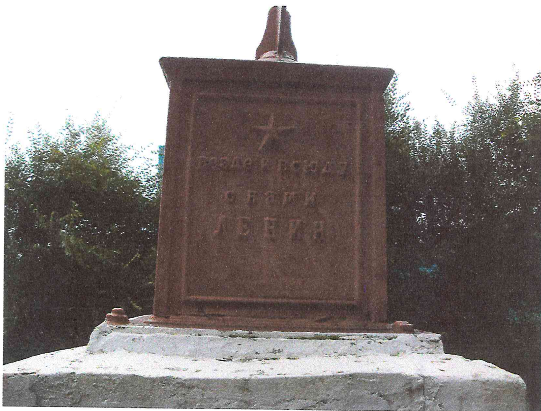
Фото 6. Объект культурного наследия «Обелиск в память погибших в борьбе за установление Советской власти девяти рабочих чугуно-литейного завода»