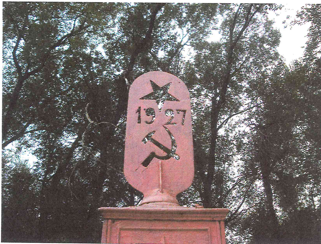
Фото 4. Объект культурного наследия «Обелиск в память погибших в борьбе за установление Советской власти девяти рабочих чугуно-литейного завода»