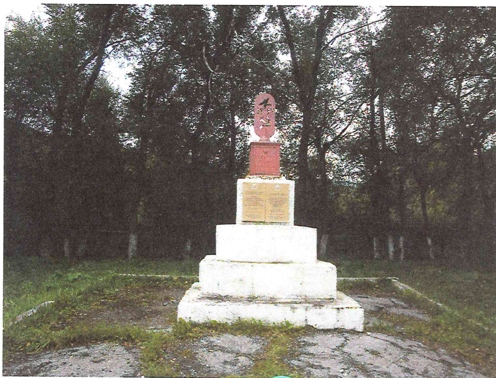
Фото 2. Объект культурного наследия «Обелиск в память погибших в борьбе за установление Советской власти девяти рабочих чугуно-литейного завода»