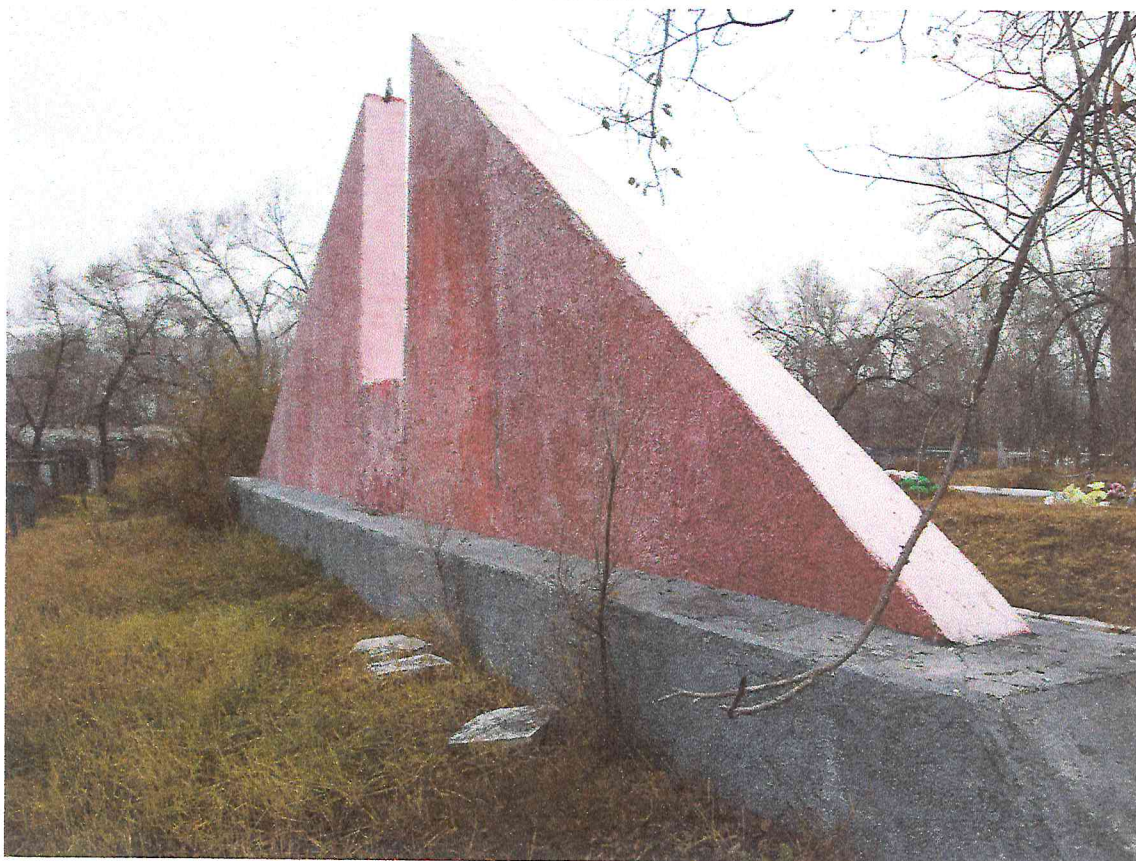
Фото 4. Объект культурного наследия «Братское кладбище воинов Советской Армии - участников Великой Отечественной войны 1941 - 1945 гг., умерших в госпиталях г. Абакана»