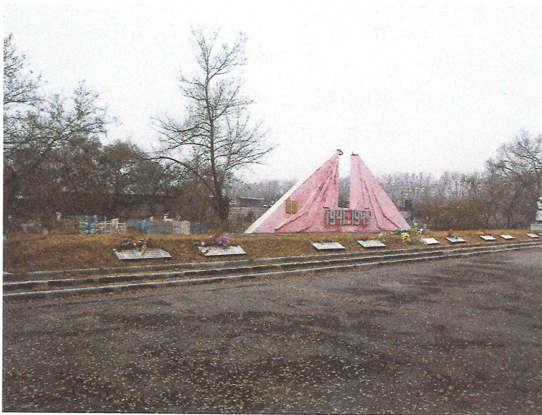
Фото 2. Объект культурного наследия «Братское кладбище воинов Советской Армии - участников Великой Отечественной войны 1941 - 1945 гг., умерших в госпиталях г. Абакана»