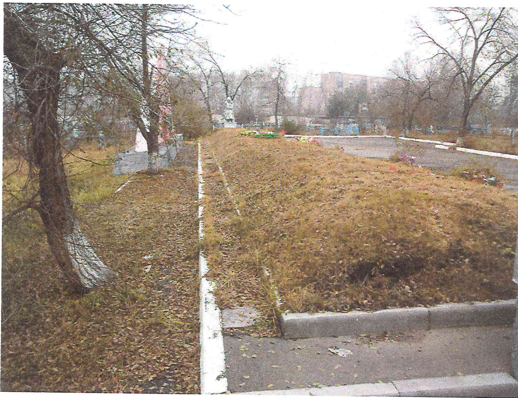
Фото 6. Объект культурного наследия «Братское кладбище воинов Советской Армии - участников Великой Отечественной войны 1941 - 1945 гг., умерших в госпиталях г. Абакана»