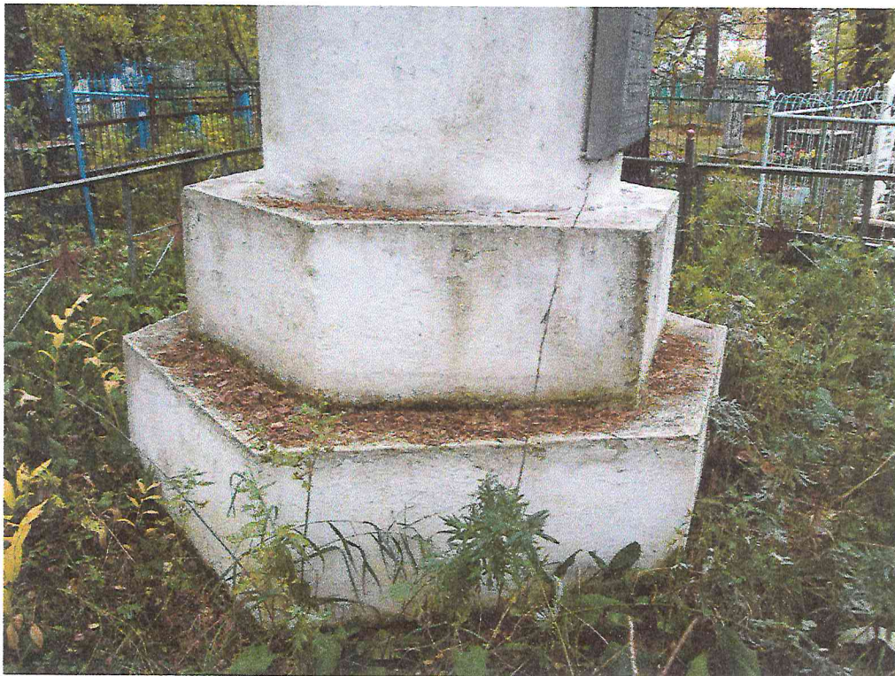
Фото 4. Объект культурного наследия «Братская могила рабочих Абаканского железодельательного завода, убитых белогвардейцами в декабре 1919 г.»