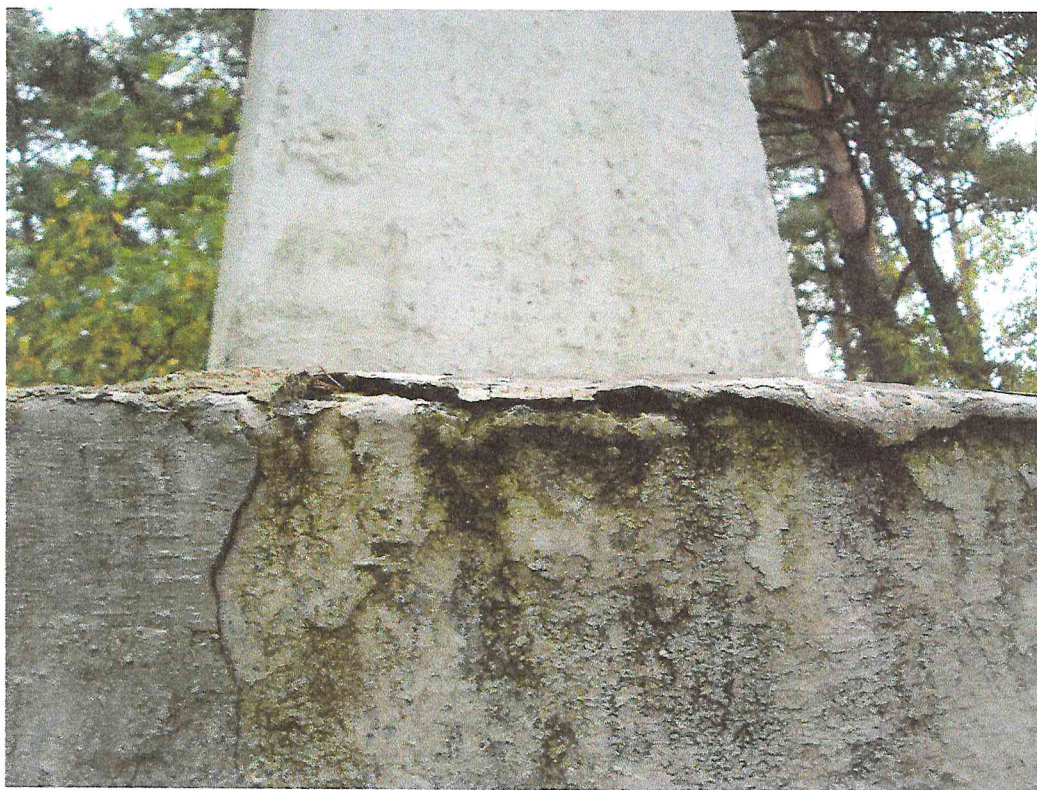
Фото 6. Объект культурного наследия «Братская могила рабочих Абаканского железодельательного завода, убитых белогвардейцами в декабре 1919 г.»