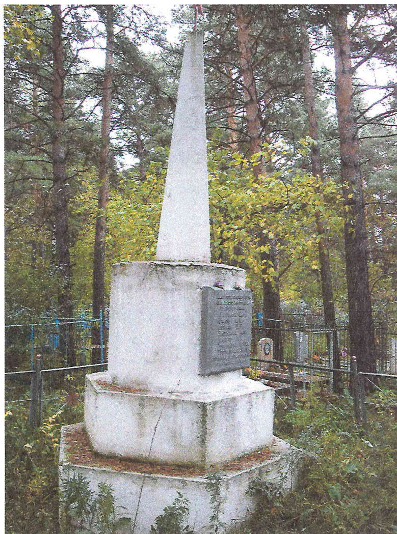
Фото 2. Объект культурного наследия «Братская могила рабочих Абаканского железодельного завода, убитых белогвардейцами в декабре 1919 г.»