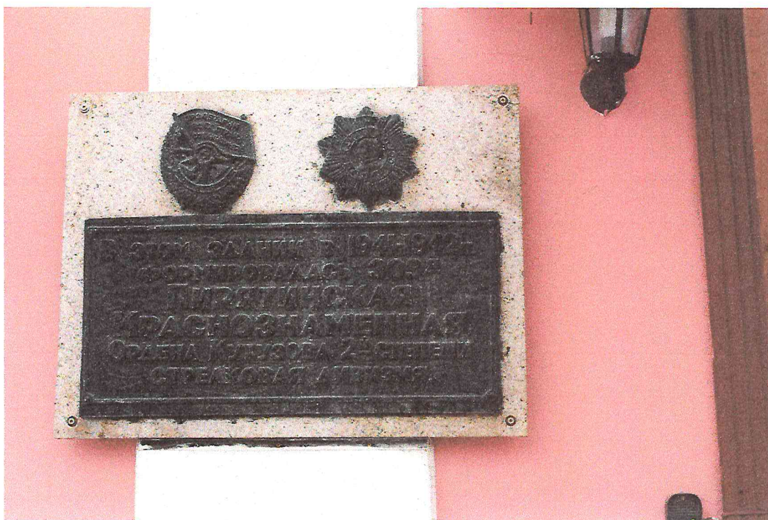
Фото 4. Объект культурного наследия «Здание, в котором в 1941-1942 гг. формировалась 309 Пирятинская краснознаменная Ордена Кутузова II степени стрелковая дивизия»