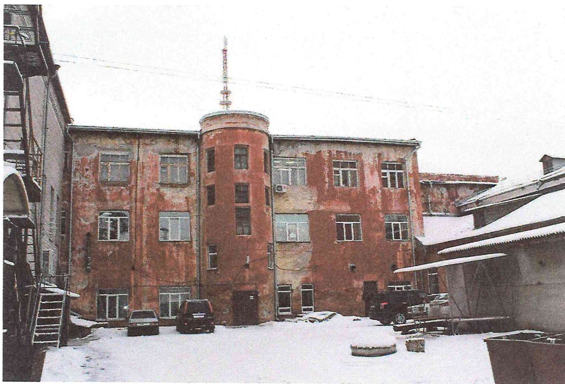
Фото 6. Объект культурного наследия «Здание, в котором в 1941-1942 гг. формировалась 309 Пирятинская краснознаменная Ордена Кутузова II степени стрелковая дивизия»