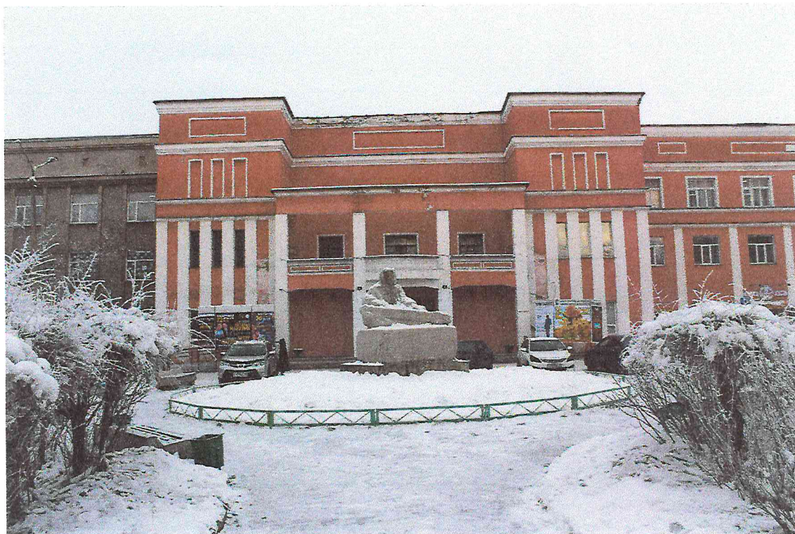
Фото 2. Объект культурного наследия «Здание, в котором в 1941-1942 гг. формировалась 309 Пирятинская краснознаменная Ордена Кутузова II степени стрелковая дивизия»