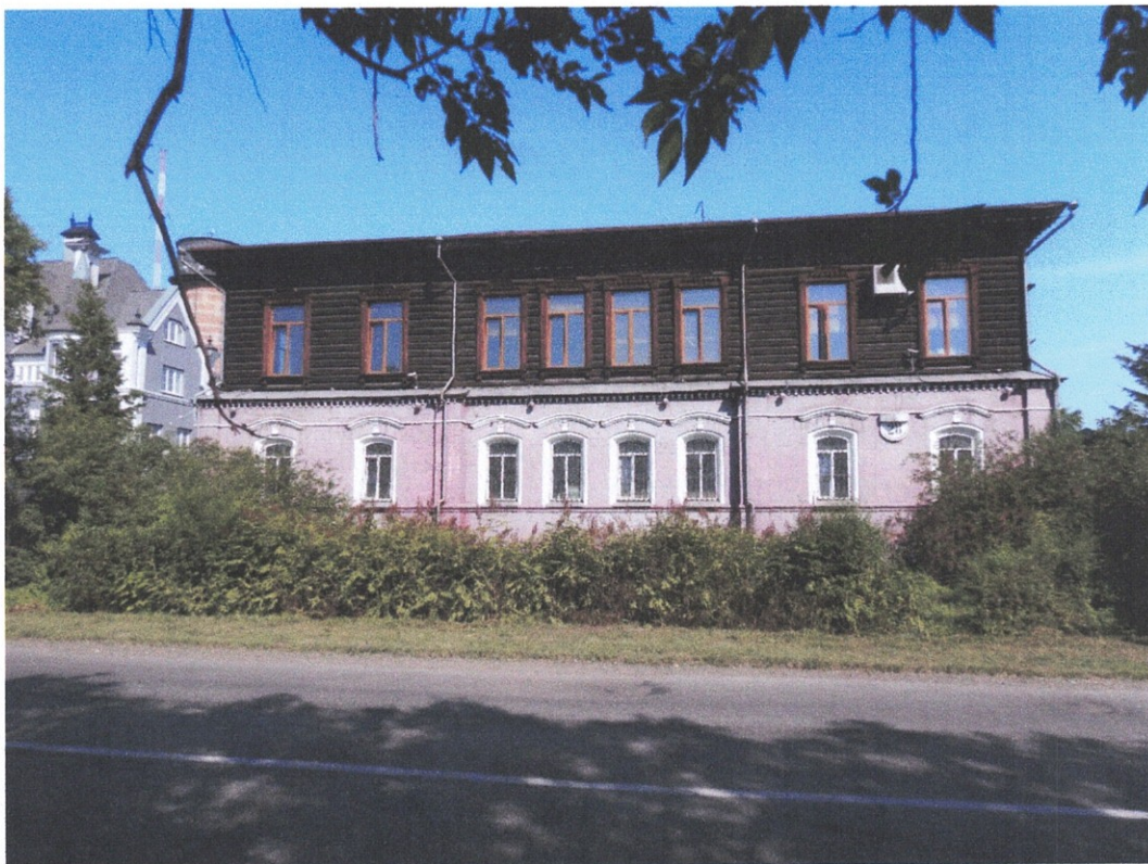
Фото: объект культурного наследия регионального значения «Школа, 1908»

Фотографическое (иное графическое) изображение объекта культурного наследия (на момент утверждения охранного обязательства)