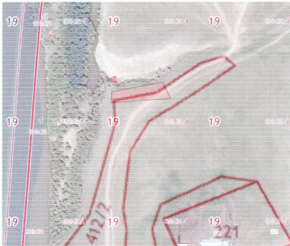
Рисунок 1. План (чертеж, схема) границ территории объекта культурного наследия (памятников истории и культуры) народов Российской Федерации на плане земельного участка, в пределах которого он располагается.