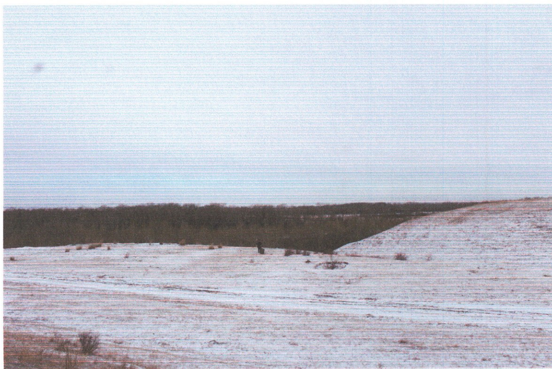
Фото 1. «Курганная группа Сартыков – 1 из 5 курганов». Общий вид с юго-востока.