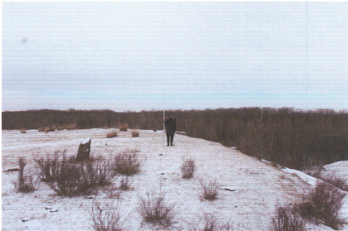
Фото 2. «Курганная группа Сартыков – 1 из 5 курганов». Курган № 1, вид с востока.