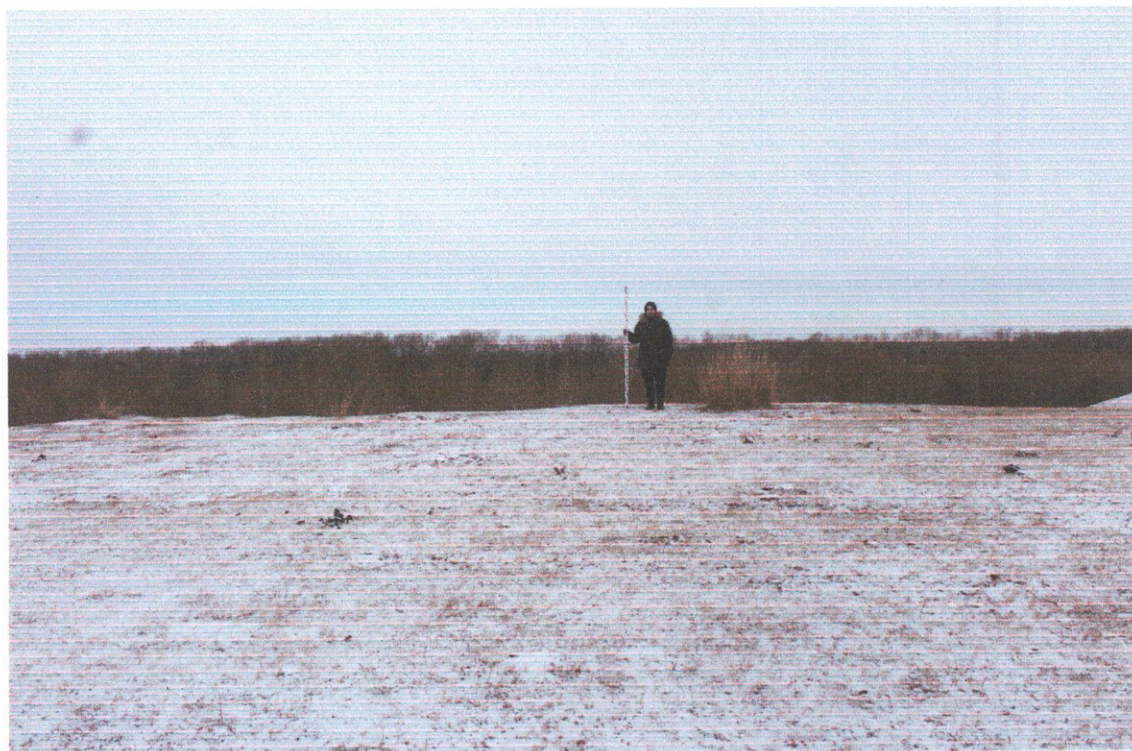
Фото 3. «Курганная группа Сартыков – 1 из 5 курганов». Курган № 3, вид с юга