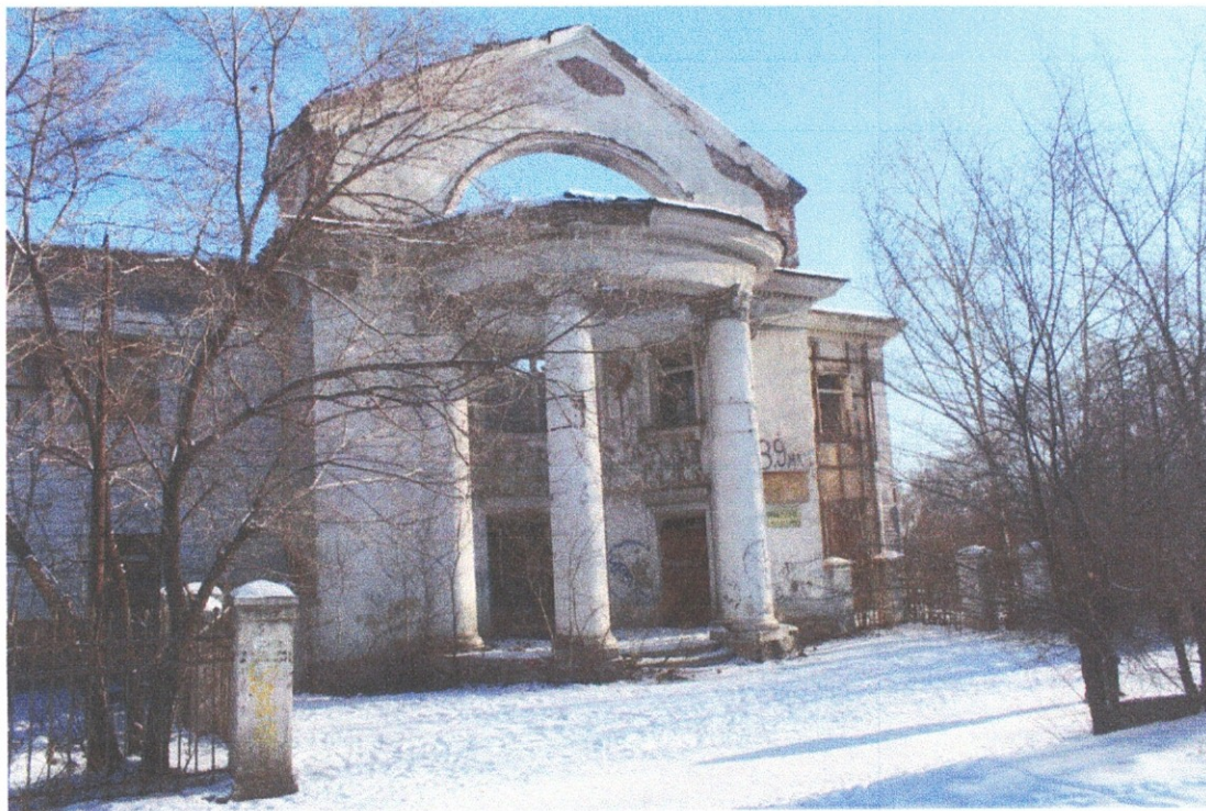
Фото: объект культурного наследия регионального значения «Дворец пионеров города Черногорска»

Фотографическое (иное графическое) изображение объекта культурного наследия (на момент утверждения охранного обязательства)