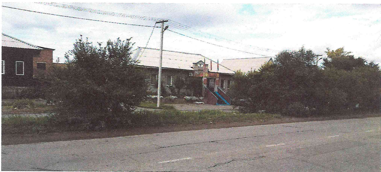
Фото 5. Объект культурного наследия регионального значения «Здание, в котором с января по ноябрь 1924 г. размещался первый уездный революционный комитет Хакасии, руководимый большевиком Итыгиным Георгием Игнатьевичем». 2018 г.