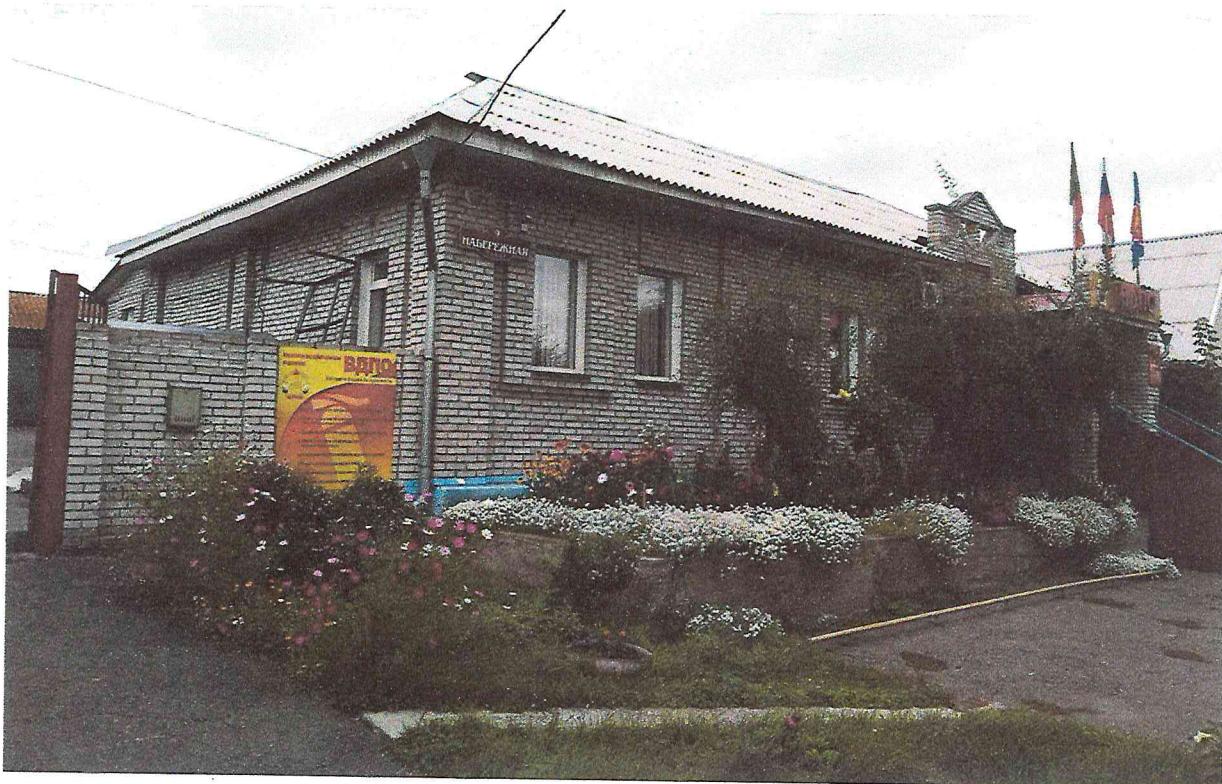
Фото 1. Объект культурного наследия регионального значения «Здание, в котором с января по ноябрь 1924 г. размещался первый уездный революционный комитет Хакасии, руководимый большевиком Итыгиным Георгием Игнатьевичем». 2018 г.