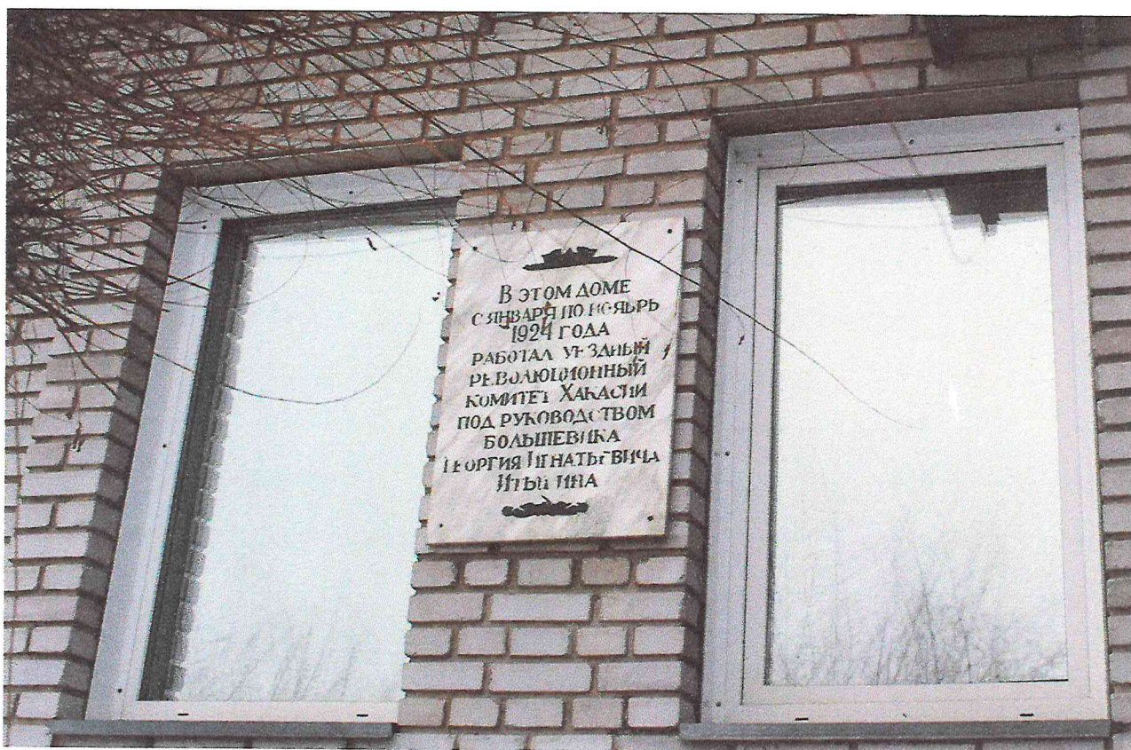
Фото 6. Объект культурного наследия регионального значения «Здание, в котором с января по ноябрь 1924 г. размещался первый уездный революционный комитет Хакасии, руководимый большевиком Итыгиным Георгием Игнатьевичем». 2018 г.