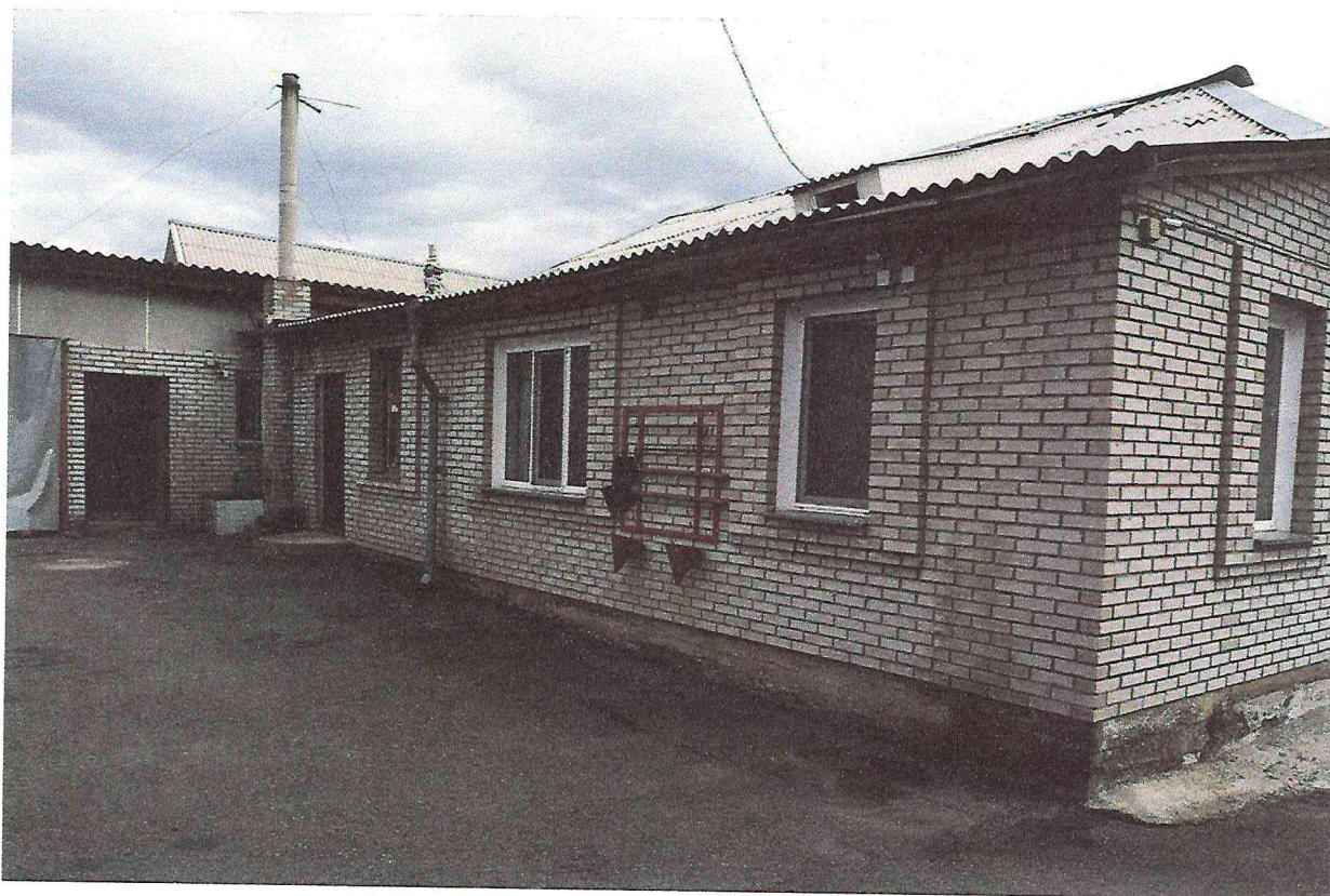
Фото 2. Объект культурного наследия регионального значения «Здание, в котором с января по ноябрь 1924 г. размещался первый уездный революционный комитет Хакасии, руководимый большевиком Итыгиным Георгием Игнатьевичем». 2018 г.