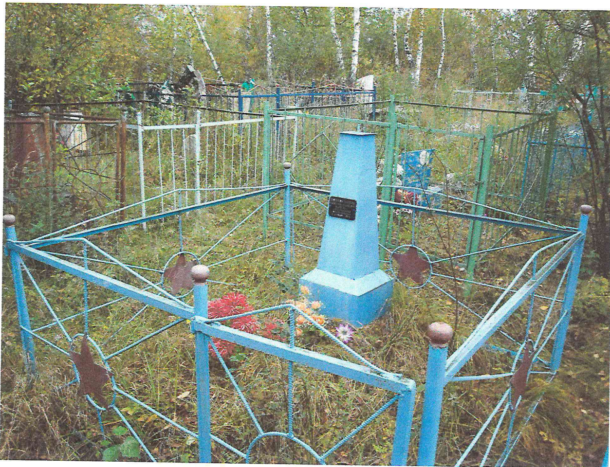
Фото 1. Объект культурного наследия регионального значения «Братская могила партизан и мирных жителей, расстрелянных белогвардейцами в декабре 1919». 2017 г.