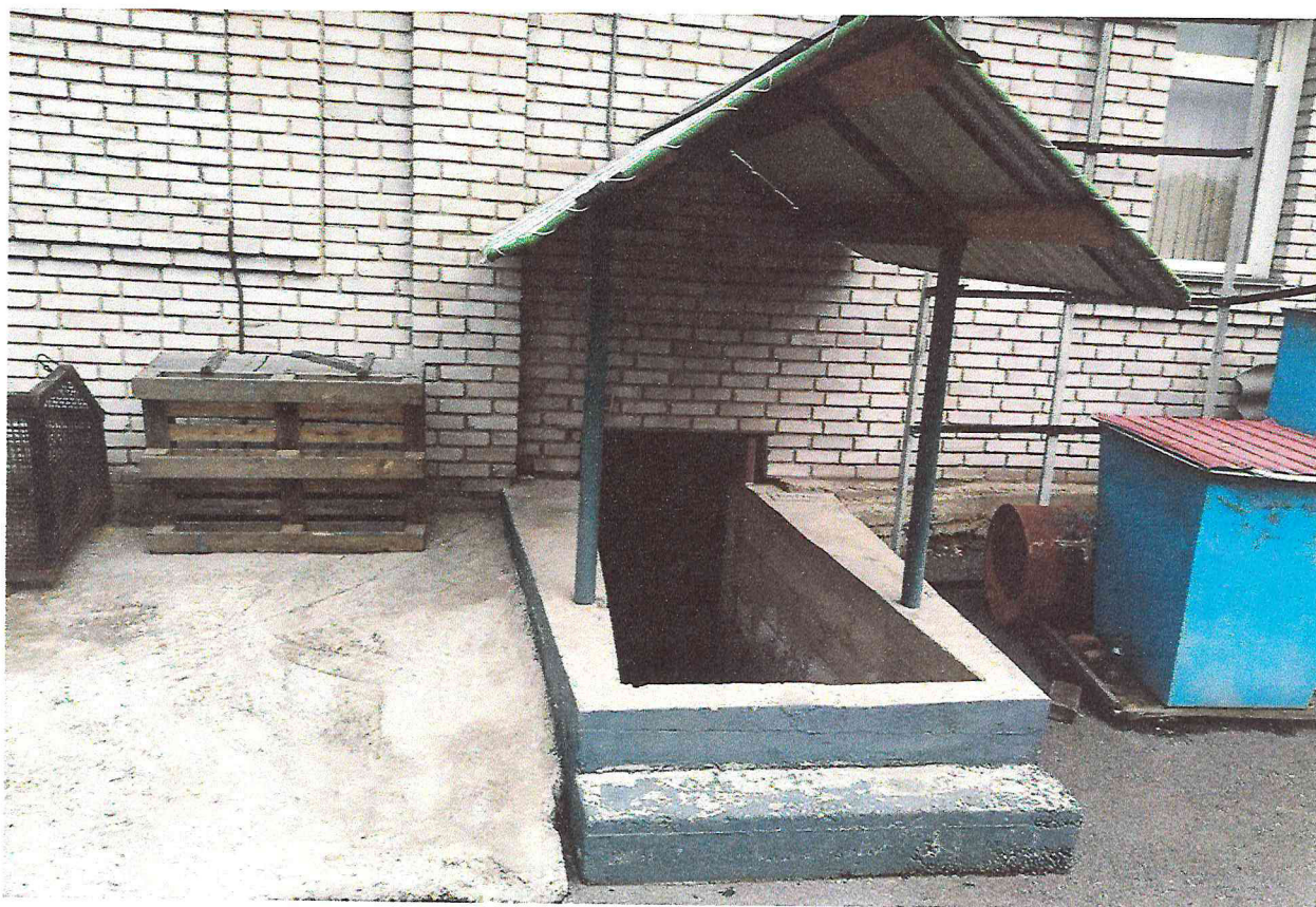
Фото 3. Объект культурного наследия регионального значения «Здание, в котором с января по ноябрь 1924 г. размещался первый уездный революционный комитет Хакасии, руководимый большевиком Итыгиным Георгием Игнатьевичем». 2018 г.