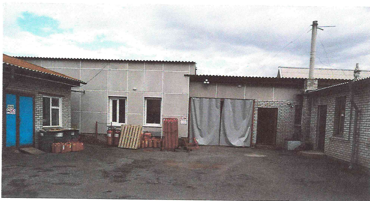
Фото 4. Объект культурного наследия регионального значения «Здание, в котором с января по ноябрь 1924 г. размещался первый уездный революционный комитет Хакасии, руководимый большевиком Итыгиным Георгием Игнатьевичем». 2018 г.